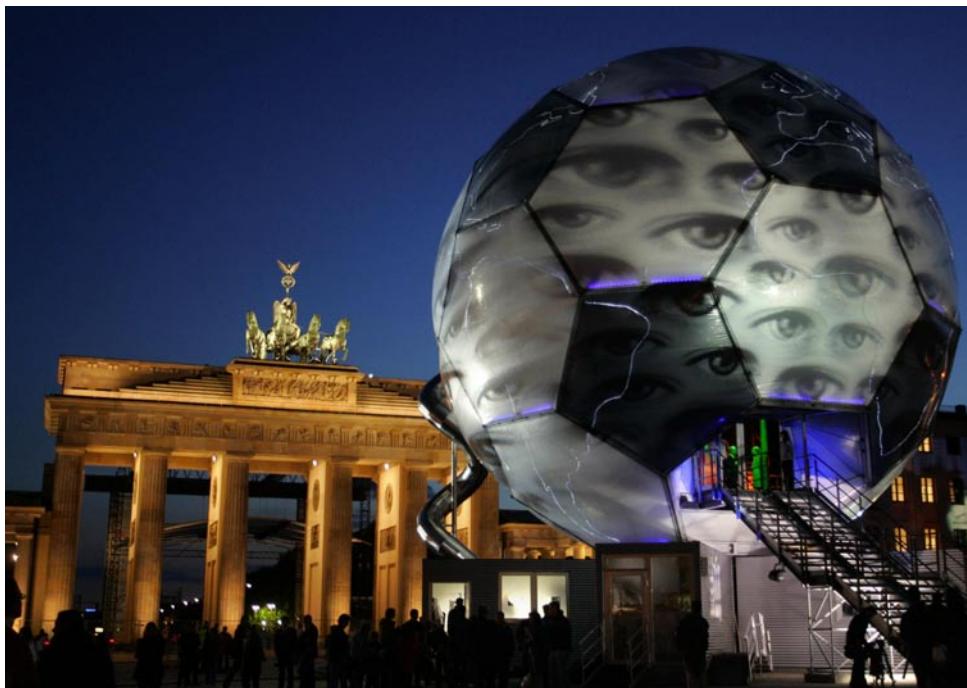
VM i Tyskland er en guldgrube for udbydere af sportsspil. Men det tyske Oddset, der har satset kraftigt på mesterskaberne som national VM-sponsor, er nu tvunget til at holde en lav profil.

Tidsskriftet Dansk Sportsmedicin er udkommet siden 1997. Foruden de idrætsmedicinske artikler indeholder bladet henvisninger til faglige arrangementer med fokus på idrætsmedicinske temaer.