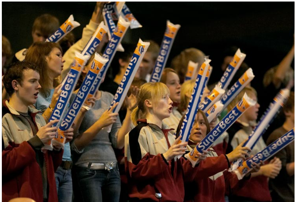
Trods stor tilskuer- og medieinteresse formår de færreste klubber at tjene penge.